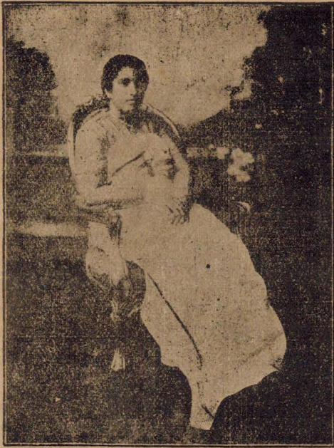
മമ്മാമ്മണി വീജൻറു തിരുമനസ്സുകൊണ്ടു്.